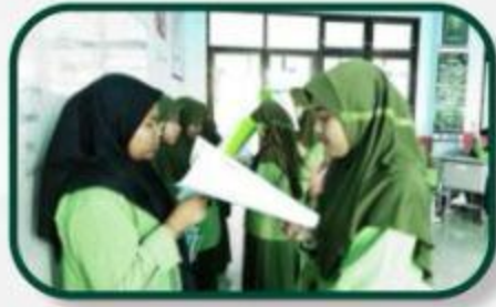
MI Class (Non Tahfidh)