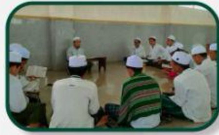
QS Class (Tahfidh)